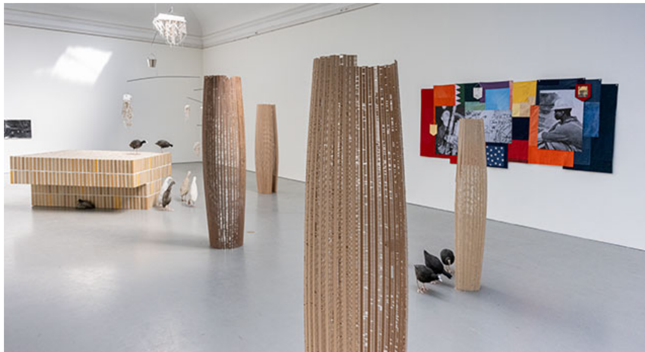
Installationavy med verk av © Ossian Söderqvist © Frida Peterson © Simon Ferner (klicka för att se hela i hög upplösning)

Kungl. Konsthögskolan, Avgångsutställning MFA Konstakademien samt Kandidatutställning BFA Skeppsholmen, Stockholm 26/5-11/6 2023 Text: Susanna Slöör