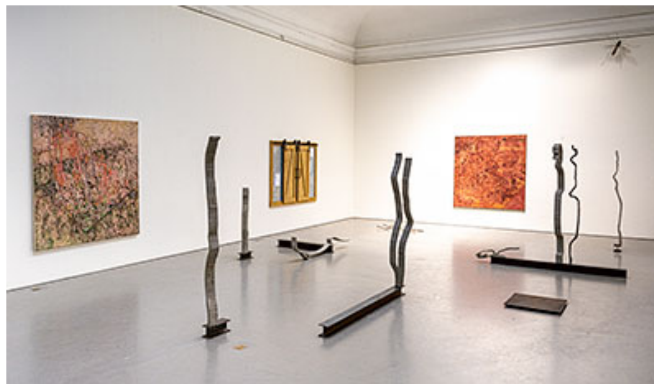
Installationavy med verk av © Philip Dufva och © Ebba Svensson (klicka för att se hela i hög upplösning)

Och det är självklart den donerade ljudstudio som fångat studenternas intresse på gott och på ont. Oavsett om detta är i frontlinjen konsthögskolor emellan har man ännu inte hittat helt rätt i mötet med en publik. Det är ett återkommande problem att skolornas navelskådande i ny(-gamla) uttryck inte förbereder studenterna bättre för att möta de som inte deltagit i undervisningen eller seminarier på skolan. För dem som genom hela sitt konstliv agerar "inhouse" är detta självklart inget problem.