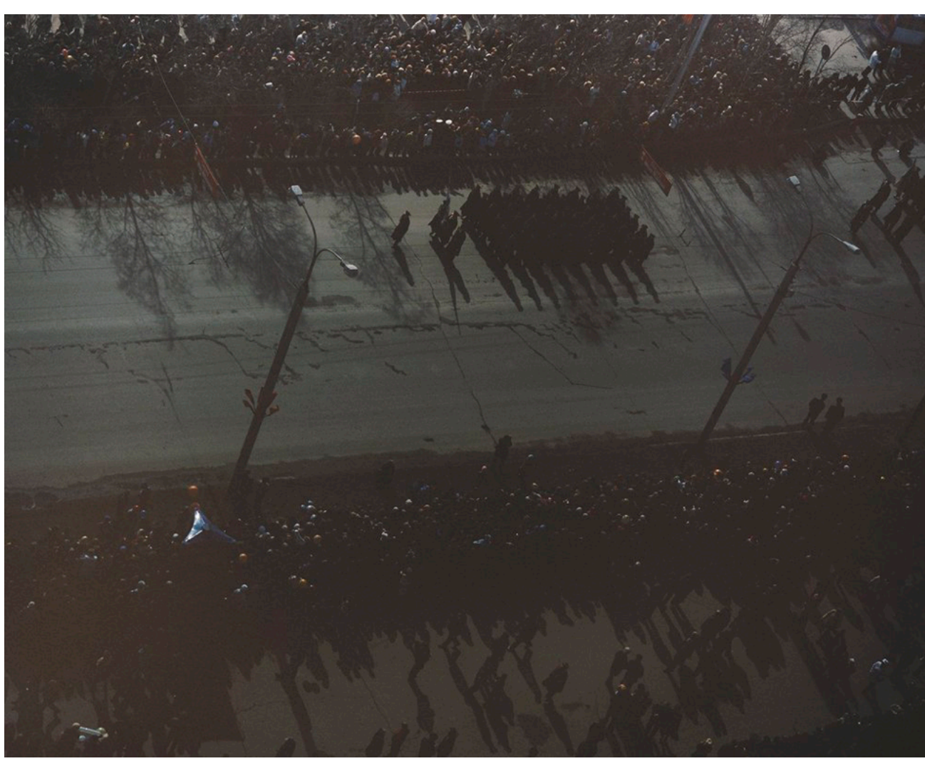
Martina Hoogland Ivanow. Far Too Close 01.

Subkulturer, personer som valt alternativa sätt att leva eller platser präglade av en specifik historia har stått i fokus i flera av Martinas verk. I boken Far Too Close (2010) ställs bilder från avlägsna platser som Sibirien, Sakhalin Island, Tierra del Fuego och Kolahalvön i kontrast till bilder tagna i en nära hemmiljö och projektet blir en visuellt spännande reflektion över avstånd och närhet och inre och yttre resande.