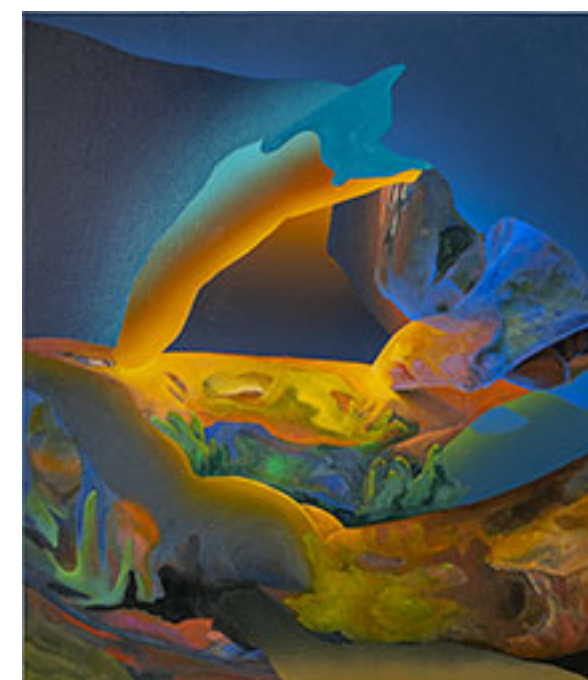
Little Mouse Went to the Well , 2022, 70 x 60 cm © Siiri Jüris