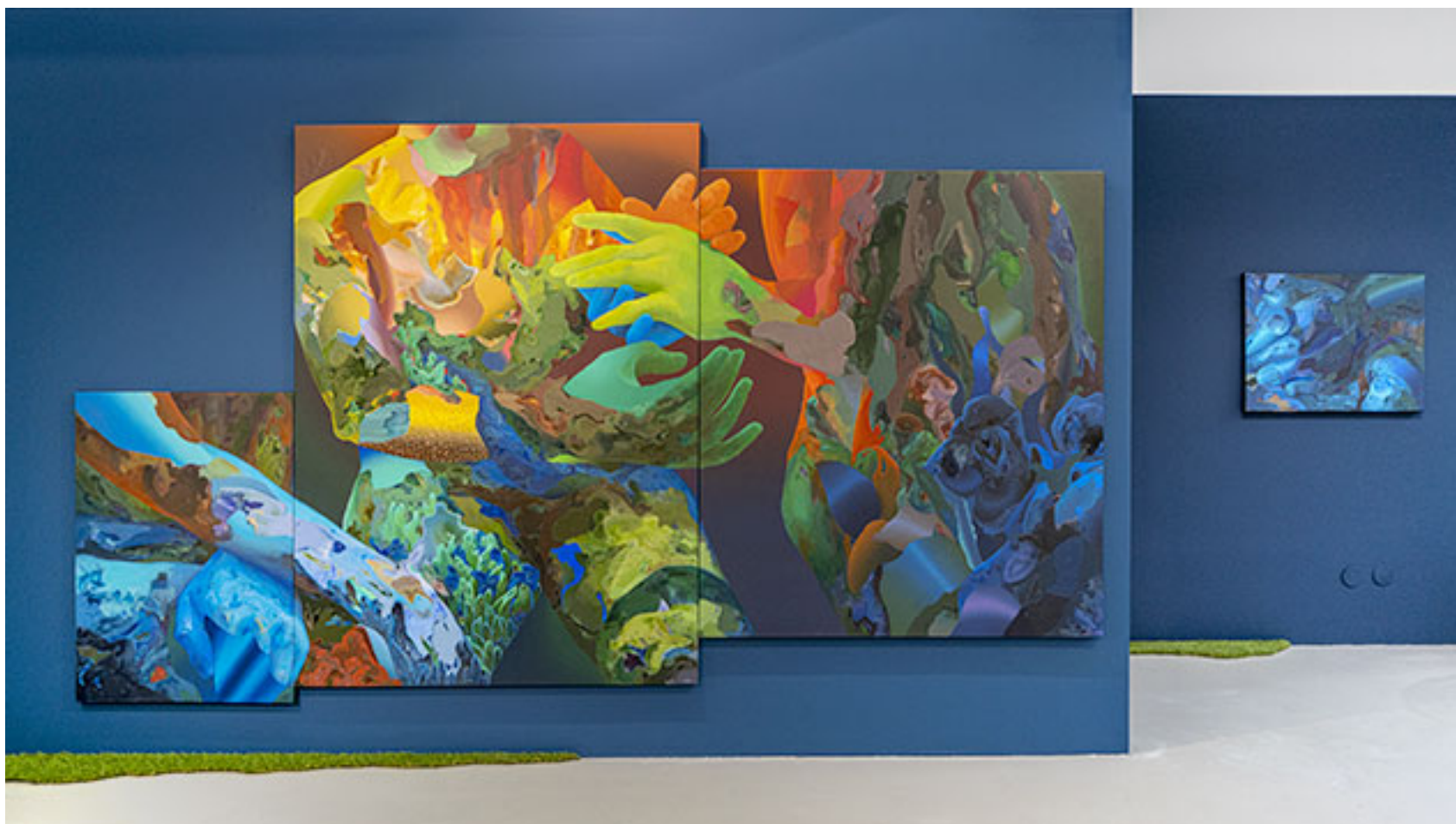
Installationsvy © Siiri Jüris (Klicka på bilden för hög upplösning)

Kombinationen av rituella handgester och högt uppdrivna färgackord ger Siiri Jüris målningar ett närmast drömligt uttryck. Genom att överge det klassiska systemet med ljusbeskrivande lokalfärg låter hon istället de starka kulöraccenterna fritt få spela över formerna. Associationerna går till digital konst, dataspel eller experiment med olika blandningslägen i Photoshop. Resultatet blir ofta överraskande och fascinerande; fragmenteringen av de landskapsliknande och organiska formerna bjuder perceptionen på en utmanande tolkningsresa.