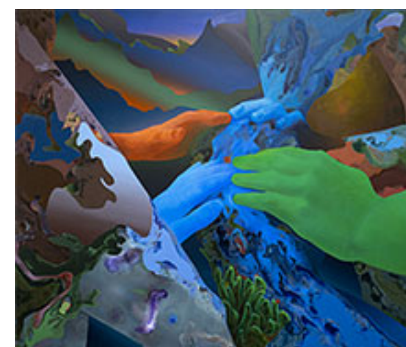
Devils Game , 2022, 110 x 130 cm © Siiri Jüris

Galleri Duerr, Stockholm | Omkonsts startside