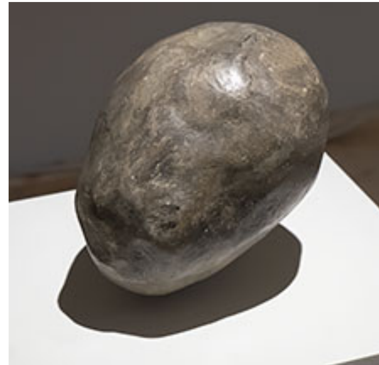
Ur serien Sven och Ingvar © Karl Dunér (Klicka på bilden för hög upplösning)