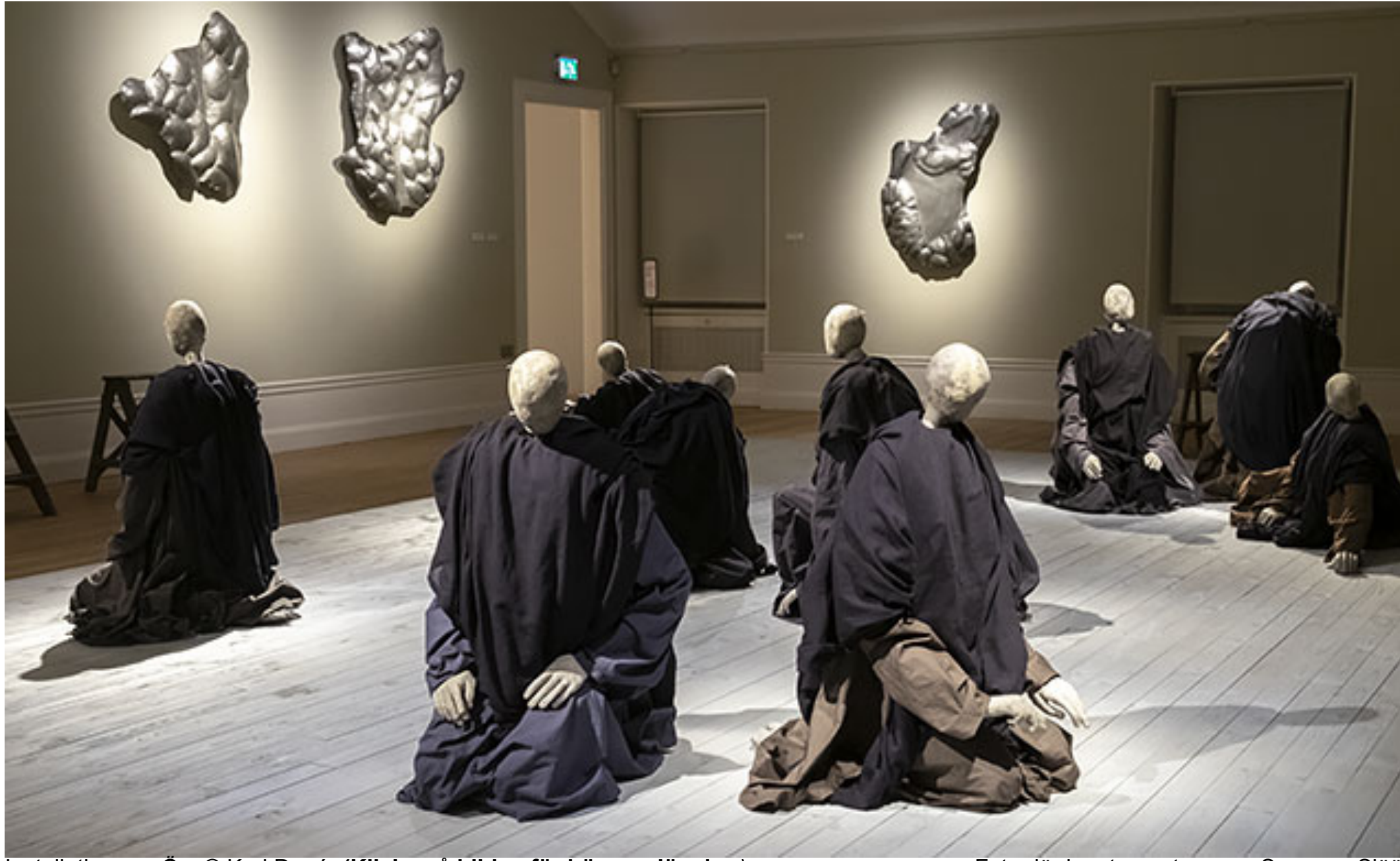
Installationsvy, Öar © Karl Dunér (Klicka på bilden för hög upplösning)

Foto där inget annat anges: Susanna Slöör