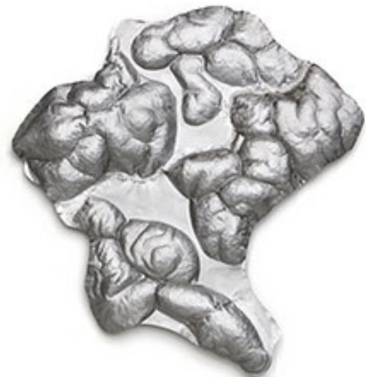
Plåt 2, Bensalem © Karl Dunér Foto: Lars Engelhardt