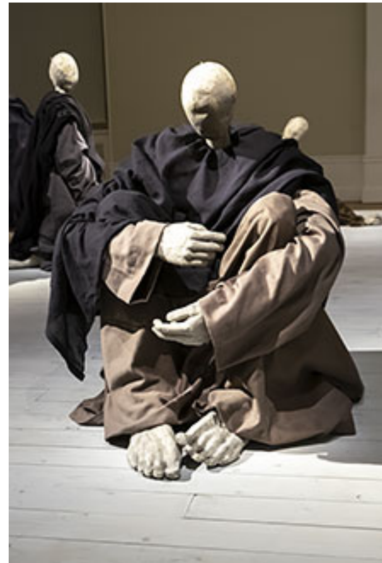
Installationsvy, Öar © Karl Dunér