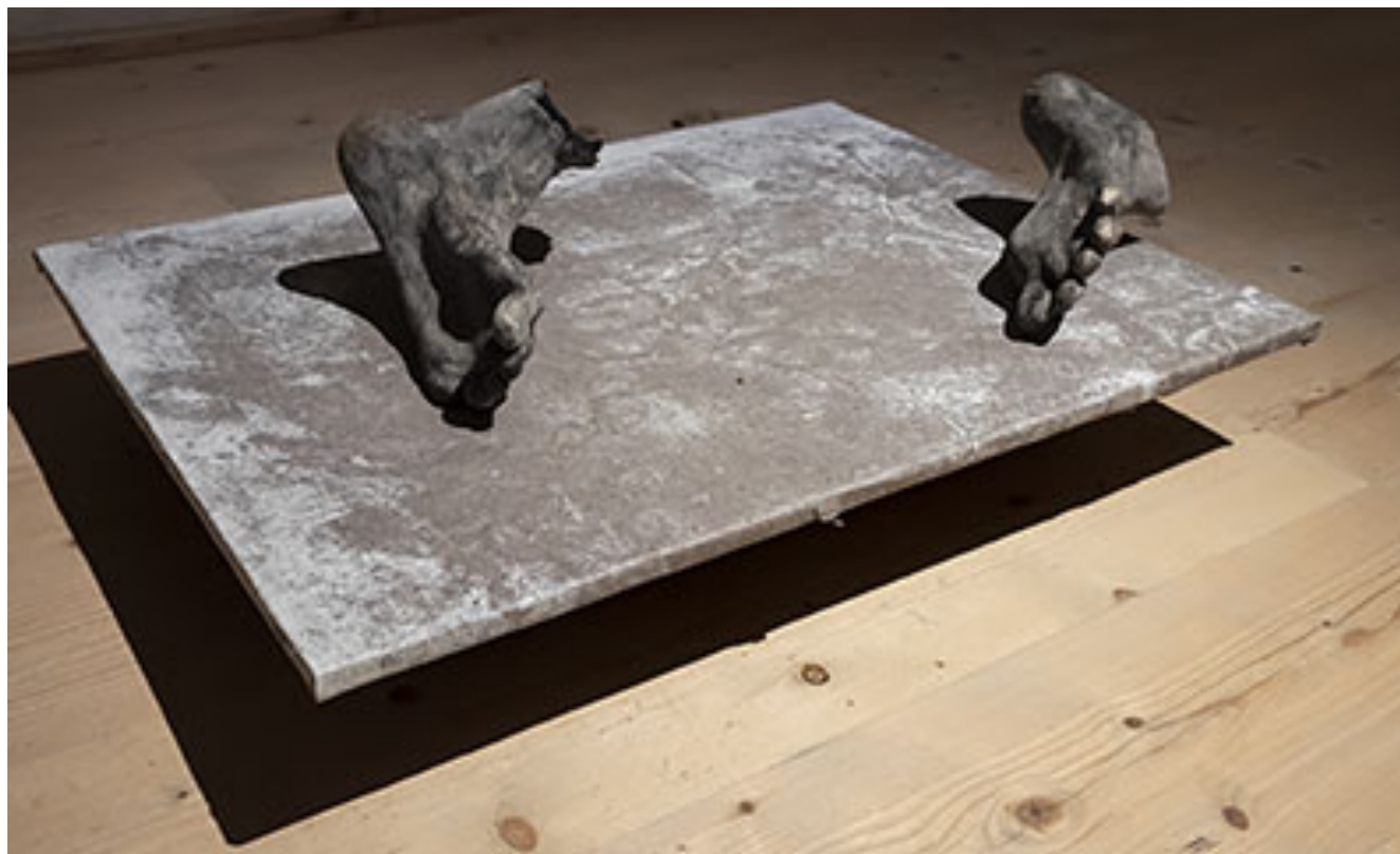
Ur serien (Klicka på bilden för hög upplösning)

Däremot lämnar han med samma självklarhet de farvatten som handlar om att få människor att samspela och driva en berättelse. Här tar istället tingen över, inte egentligen som aktörer, men som ställföreträdare klär de sig i livets andedräkt.