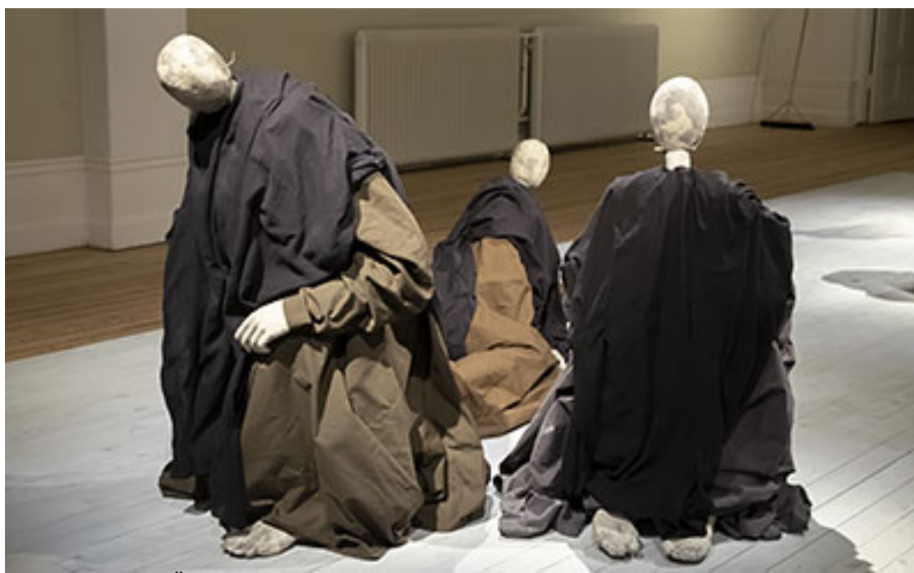
Installationsvy, Öar

Jag tar tacksamt till mig synen av den närmaste dockans plötsliga andetag. Manteln runt axlarna och den låtsade bröstkorgen häver sig lugnt och stilla. Längtan efter stillheten och långsamheten väcker Karl Dunér skickligt med precis så få händelser som möjligt. Det är nästintill omöjligt att slita sig från verket och särskilt om det är få övriga besökare att ta hänsyn till.