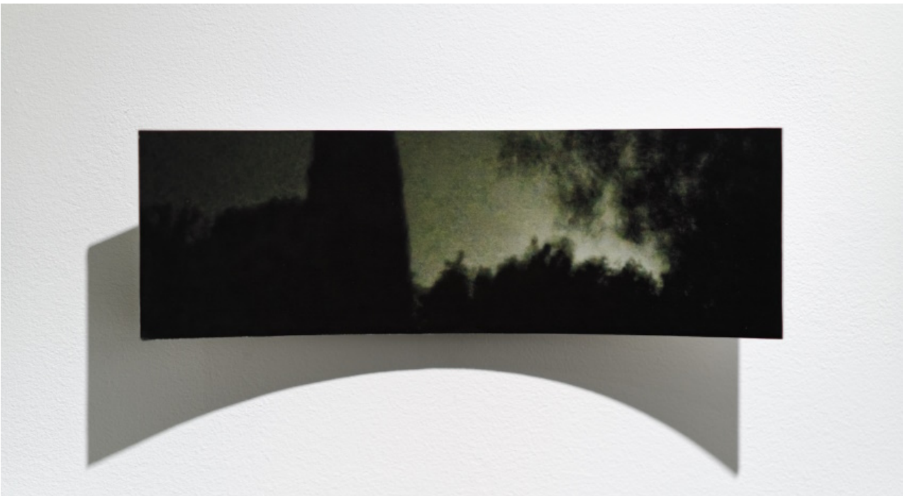
Karl Dunér, Parabol 15, 2023.

Rakt över gården och uppför trappan hos Galleri Duerr ställer Karl Dunér ut fotografier och målade bilder monterade på böjda aluminiumskivor. Nästan alla 29 verk i sviten har samma parabolformade inbuktning. Titlarna är repliker tagna ur Aischylos förlorade pjäs