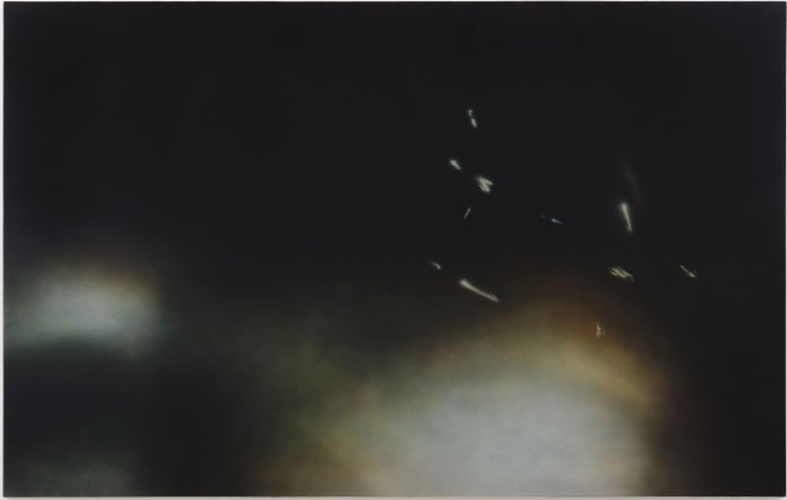
Jéronimo Rüedi, Nothing happens (and it keeps not happening forever), 2022.