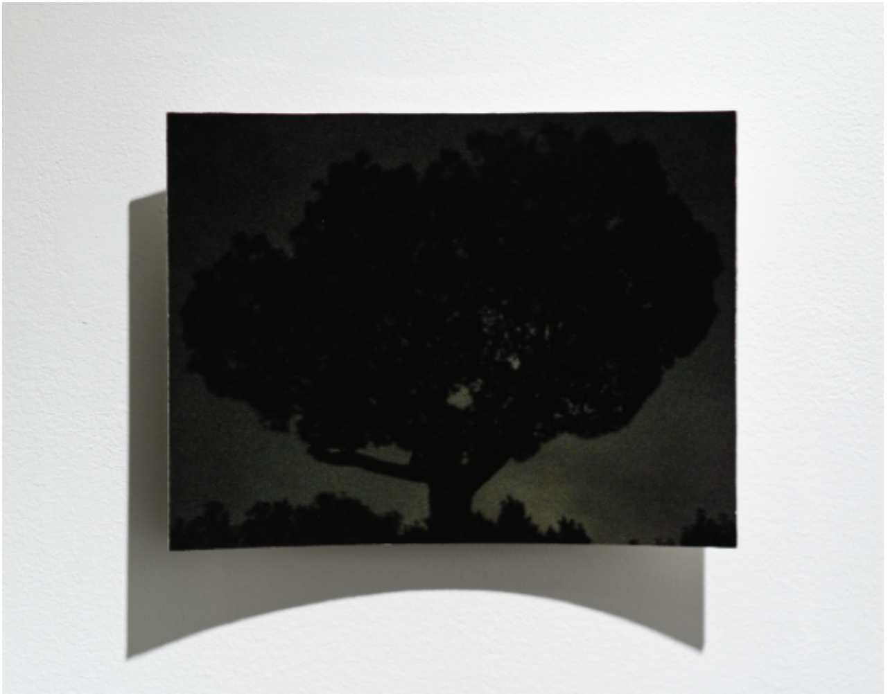
Karl Dunér, Parabol 10, 2023.