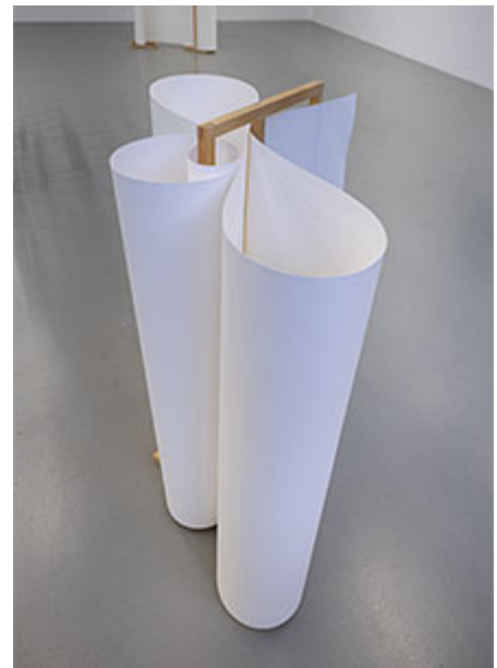
Ur serien Judy , akvarellpapper, trä © Helén Svensson