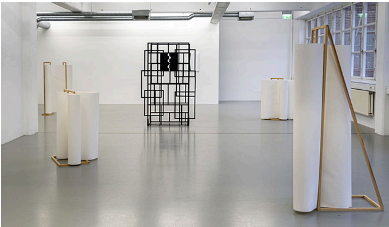
Installationsvy (klicka på bilden för hög upplösning)